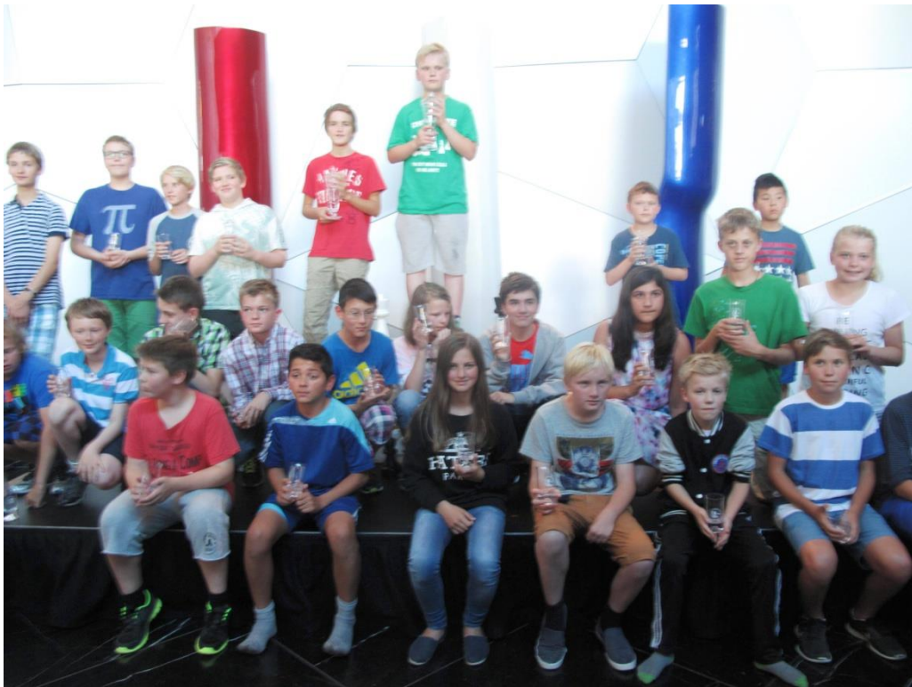
Landsturneringen 2014, klasse lilleputt.