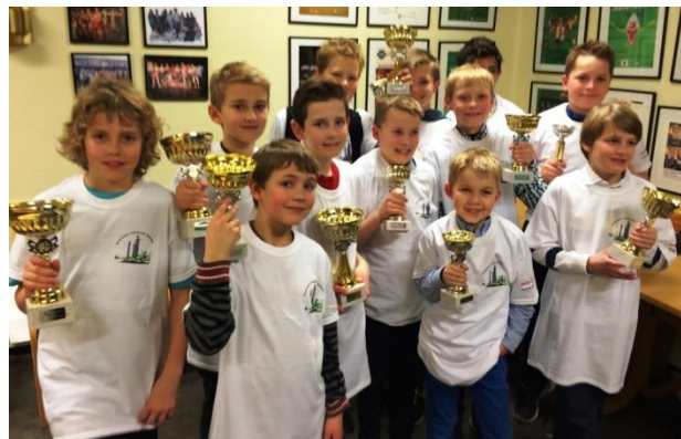
Historisk mesterskap i Rogaland med hele 206 deltakere fordelt på 48 lag. Her er de tre fremste lagene i barneskoleklassen.