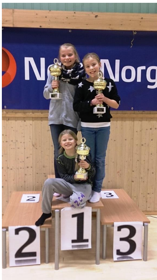
Historisk søskentriumf med tre NM-titler til søstrene Skaslien.