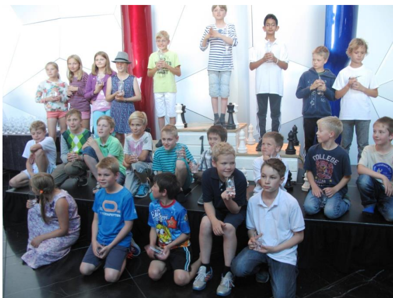
Flinke deltagere i klasse miniputt i Landsturneringen.